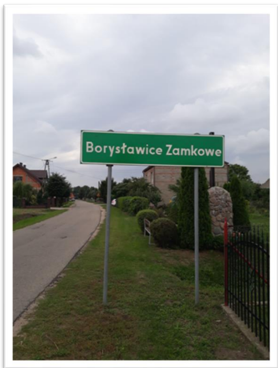
Wjazd do Borysławic Zamkowych