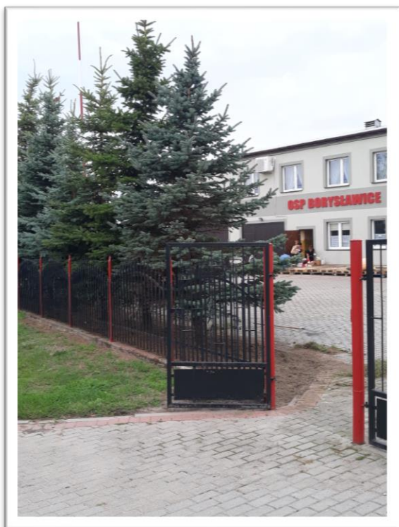
Remiza OSP Borysławice