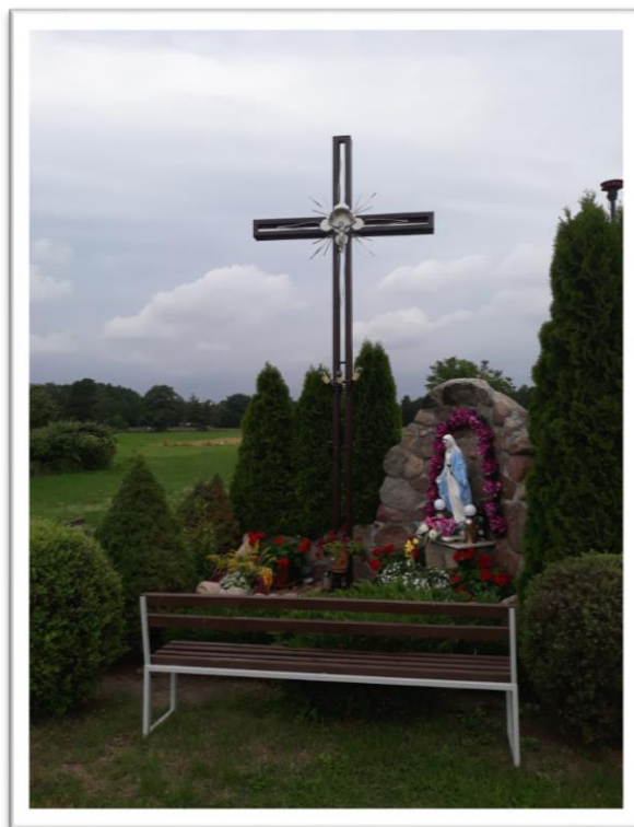
Kapliczka Matki Boskiej Niepokalanej