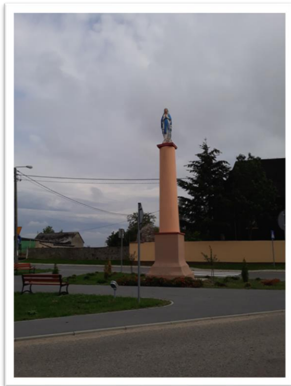
Centrum Borysławic Kościelnych