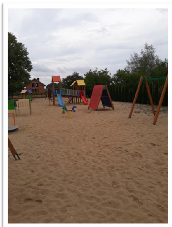
Plac zabaw przy szkole