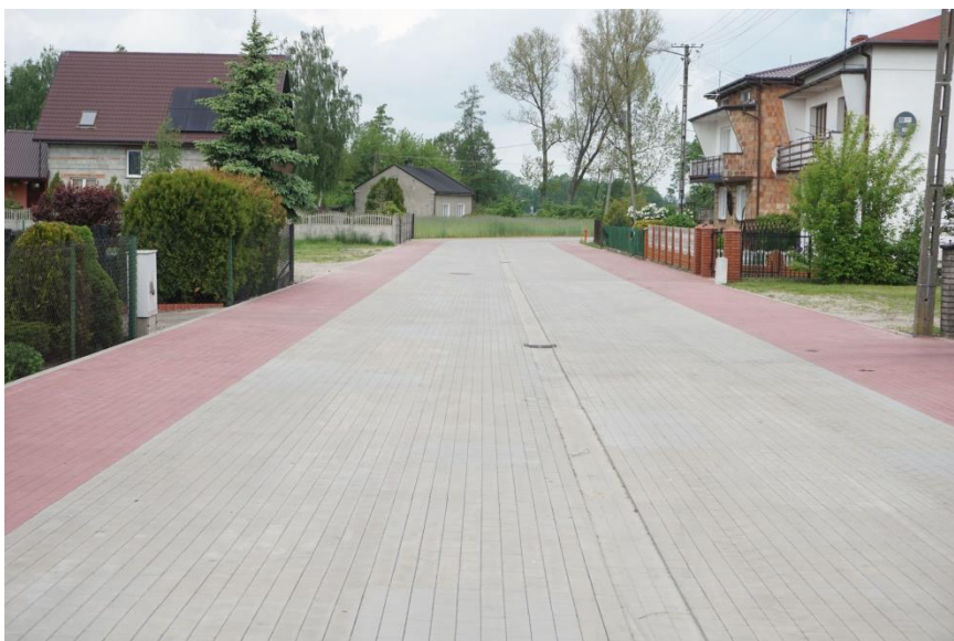
Ulica Rieczna w Barłogach