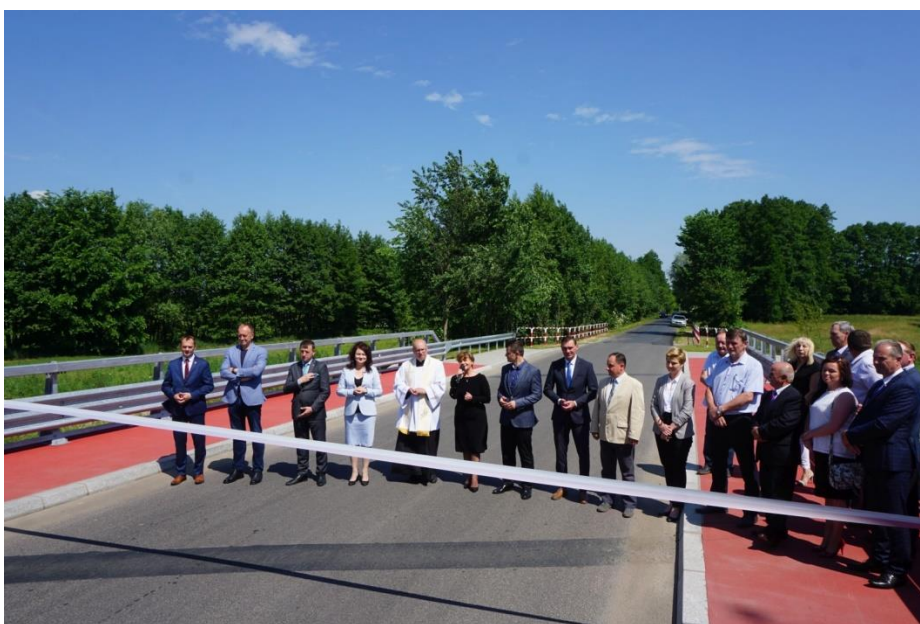
Odbiór mostu w Barłogach