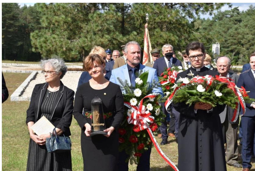
Uroczystość w byłym niemieckim Obozie Zagłady Kulmhof w Chełmnie nad Nerem