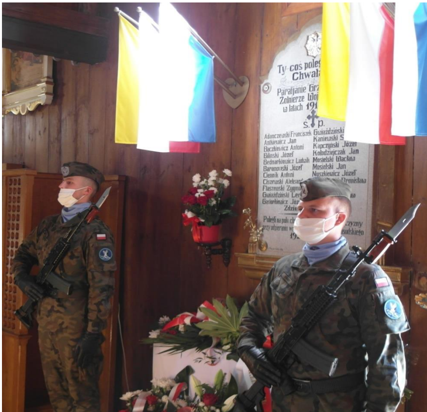
Obchody 100. rocznicy Bitwy Warszawskiej 1920r. i Święta Wojska Polskiego