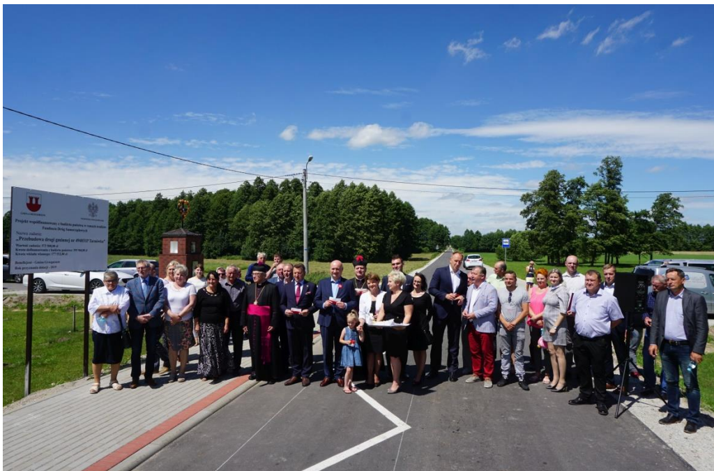
Odbiór drogi gminnej w miejscowości Tarnówka