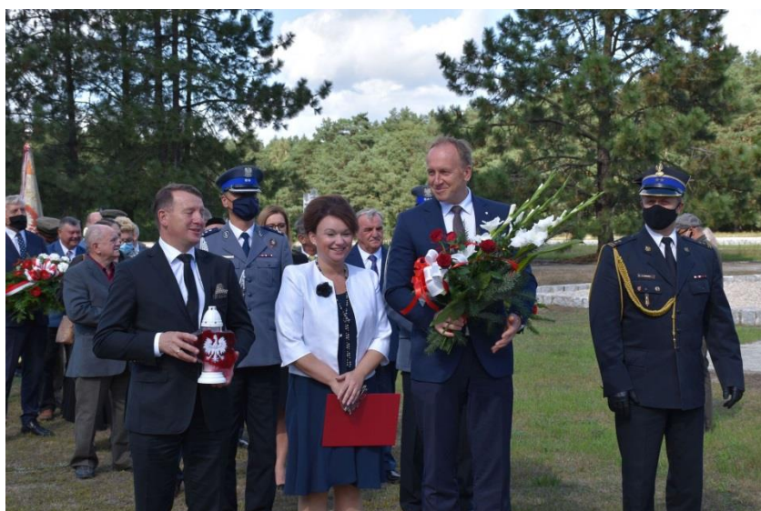
Uroczystość w byłym niemieckim Obozie Zagłady Kulmhof w Chełmnie nad Nerem