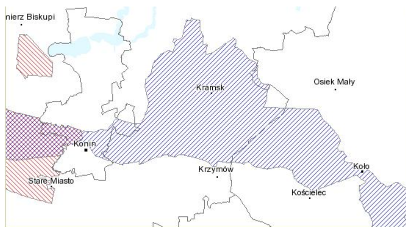
Skala 1 : 196 375 Rys.3 Lokalizacja Obszaru Natura 2000 Dolina Środkowej Warty