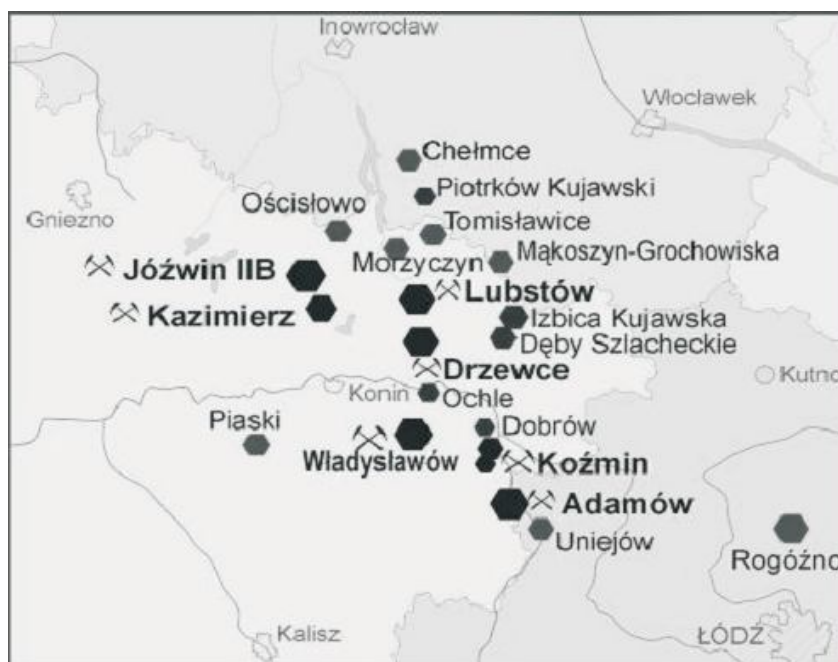
Rys.3. Zloža eksploatowane i perspektywiczne KWB „Pątnów” i „Adamów”

Obecnie Kompanii Węgla Brunatnego „Konin” udostępniono złożo „Drzewce”. Posiada ono jeden pokład należący do utworów trzeciorzędowych i składa się z trzech pól: Bilczew, Drzewce A oraz Drzewce B. Zasoby przemysłowe odkrywki Drzewce to 35,2 mln ton. Grubość nadkładu waha się od 7,9 m w polu Bilczew do 51 m w polu B. W sumie nad złożem zalega około 181 mln m 3 nadkładu. Wartość opałowia węgla