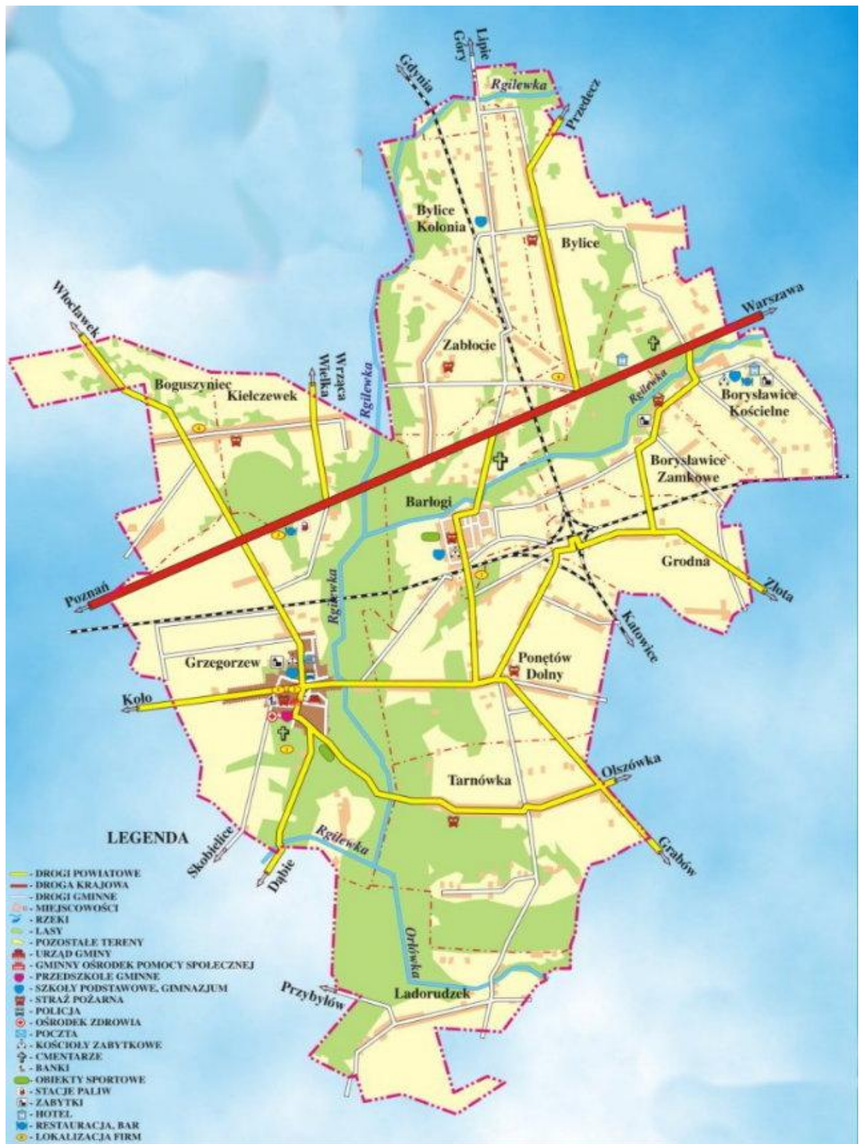
Ryc. 1. Mapa Gminy Grzegorzew