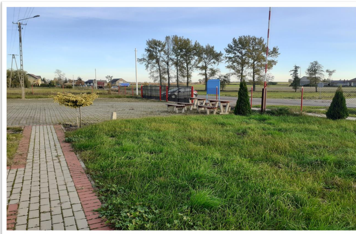
Teren przy świetlicy wiejskiej