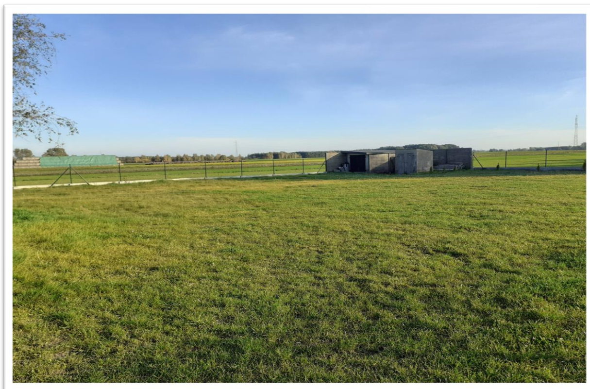
Teren za świetlicą Ochotniczej Straży Pożarnej