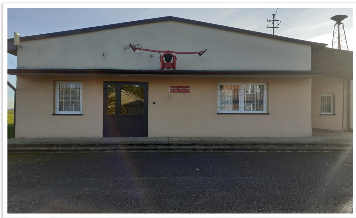
Świetlica Ochotniczej Straży Pożarnej